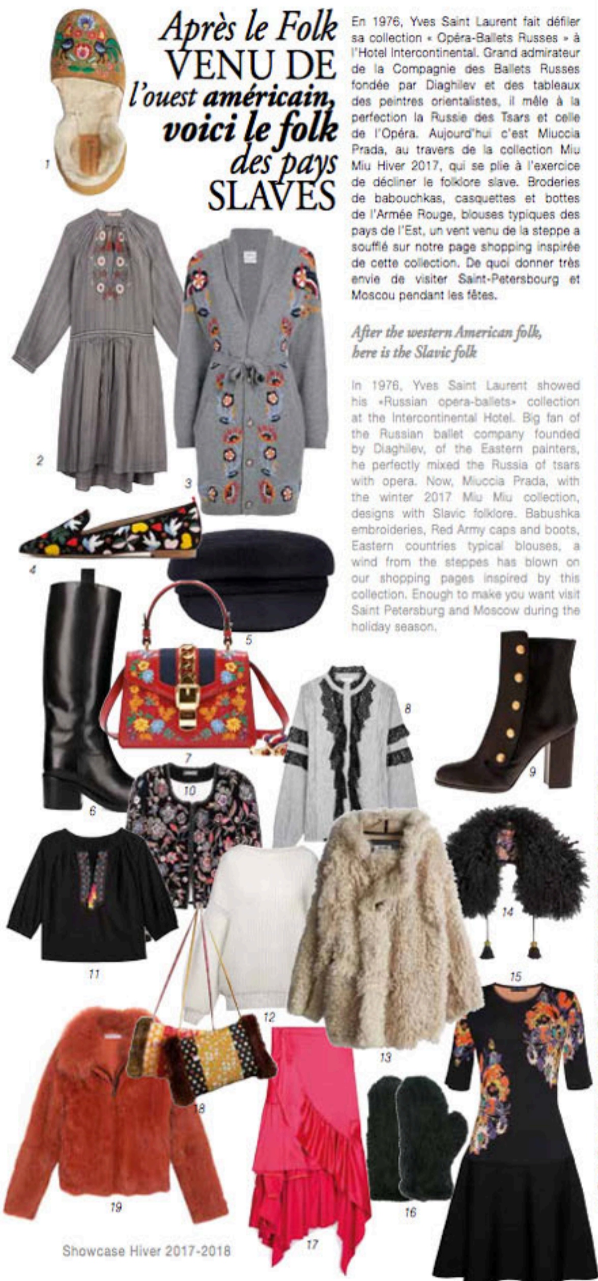
Showcase Hiver 2017-2018